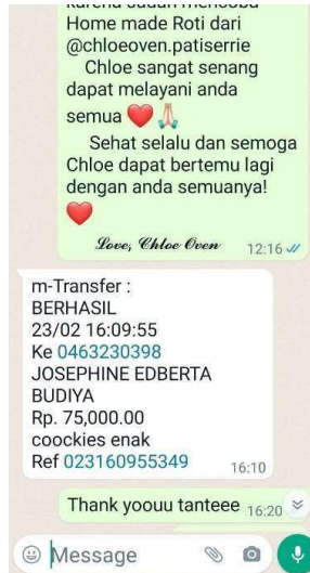
Picture 43. Custom order Letter 1