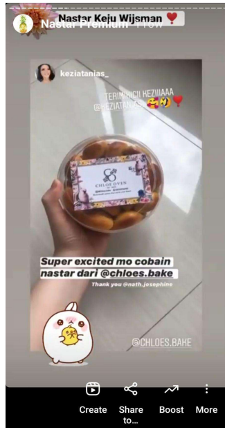
Picture 37. Testimony 2