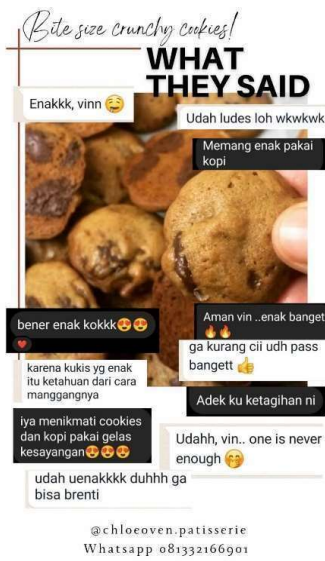
Picture 38. Testimony 3