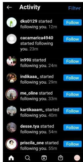
Picture 40. Ig performance 2