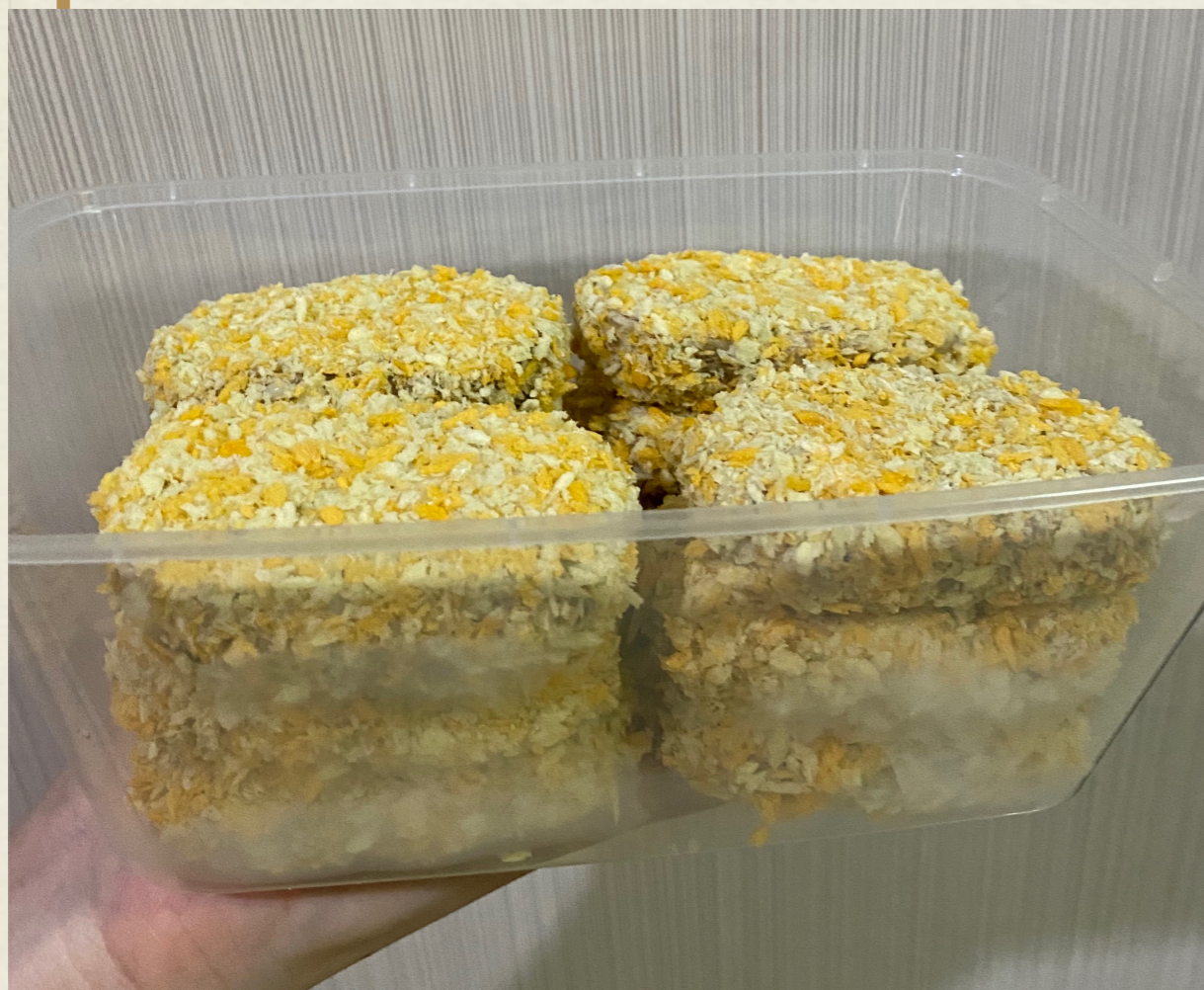
Vegan Nuggets Dari Nangka Muda